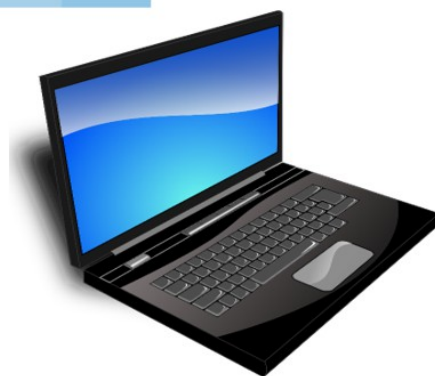
Läppäri kotiin ja joskus mukaan