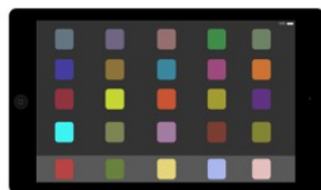
Tabletti mukaan ja kotiin